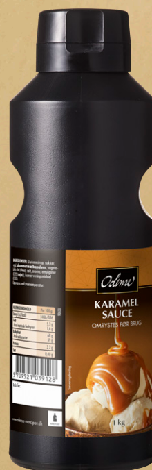
ODENSE Karamel Sauce Varenr.: 102406 Kollistørrelse: 6 x 1 kg flaske Cremet med smag af brændt karamel og som henleder tanken på søde flødekarameller.