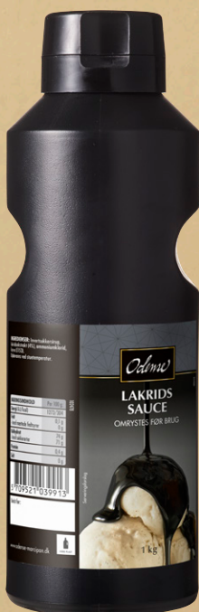
ODENSE Lakrids Sauce Varenr.: 102478 Kollistørrelse: 6 x 1 kg flaske En lækker flydende cremet dessertsauce med lakrids.