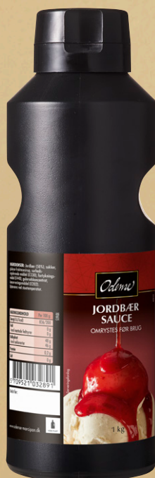
ODENSE Jordbær Sauce Varenr.: 101615 Kollistørrelse: 6 x 1 kg flaske ODENSE Jordbær Sauce indeholder 50% jordbær, som giver en autentisk sød jord- bærsmag af høj kvalitet, uden tilsætning af aroma eller farve.